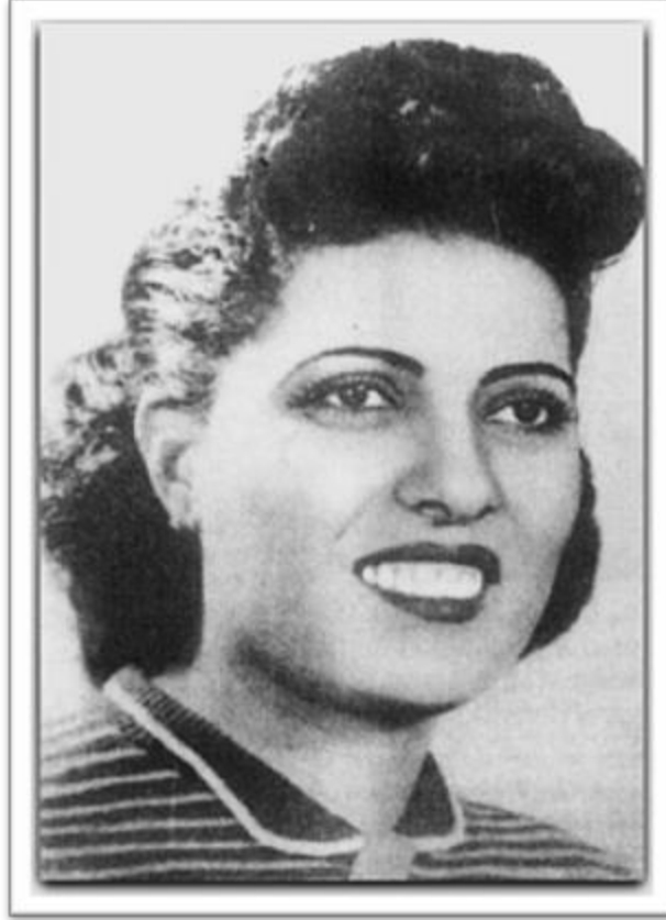
سميرة موسى – Sameera Moussa (1917 – 1952)

An Egyptian nuclear physicist, Moussa received her PhD in atomic radiation from the U.K. and organized the Atomic Energy for Peace Conference. She died in a car crash in California, USA in 1952.