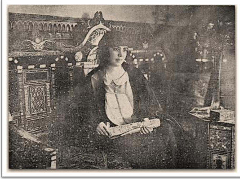
Siza Nabarawy – سيزا نبراوي (1897 – 1985)

Secretary of Hoda Sharawi, the leader of the Egyptian Suffragette Movement. Together, they organized and attended women conventions in Egypt and abroad. They were the first women to remove their veil in public, after returning from a women's convention in Rome in 1923. She became the president of the International Democratic Women Union in Berlin and led the Egyptian Feminist Union after the death of Sharawi.