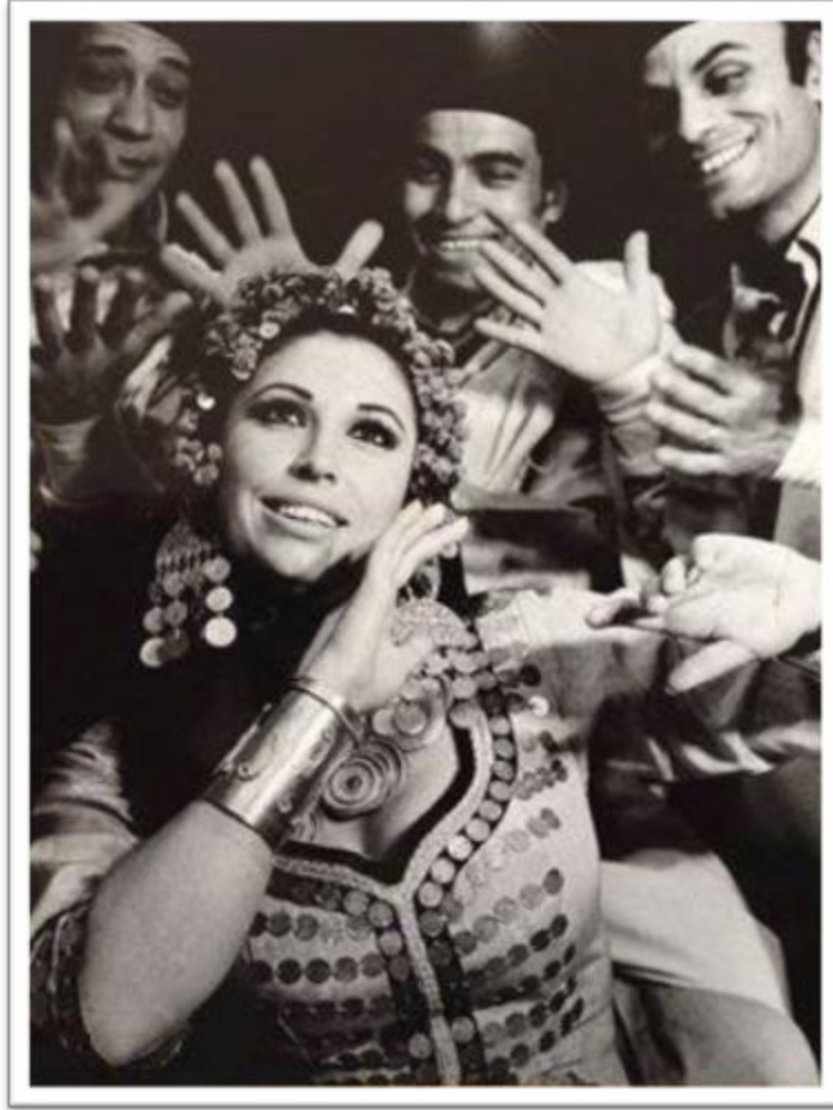
فريدة فهمي – Farida Fahmy (1940-)

Fahmy in a performance by Reda Dance Troupe, the Egyptian folkloric dance company founded in 1959 by her husband Ali Reda. In 1965, King Hussein of Jordan awarded Fahmy the Star of Jordan. In 1967, Egypt's President Nasser awarded her the Order of Arts and Science. She received the Order of Tunisia in 1973.