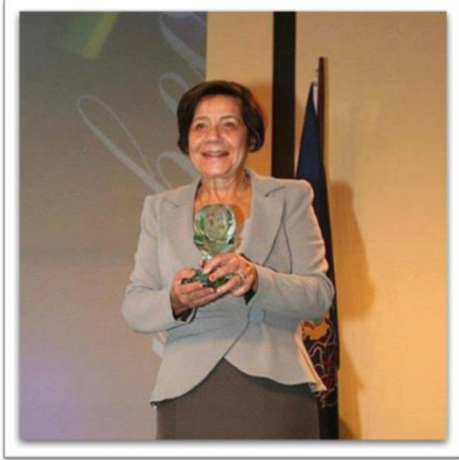
لولا زقلمة – Loula Zakalama

In 1962, Zakalama established the first private advertising company in Egypt. She was ranked number 48 among the 200 most powerful Arab women on Forbes list in 2014, and was honored as one of the 50 women who influenced the Egyptian economy in 2015.