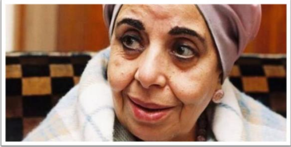
نعمات أحمد فؤاد - Nemat Ahmed Fouad (1926 – 2016)

The prominent writer and author, Nemat Fouad, a.k.a. Daughter of the Nile, was the first female student to rank number one in the national high school exams. She received her PhD in Arabic literature in 1959. Fouad authored many books, among which are “Om Kulthum and the Nile” and “To My Daughter”, which was translated to English by the UNESCO.