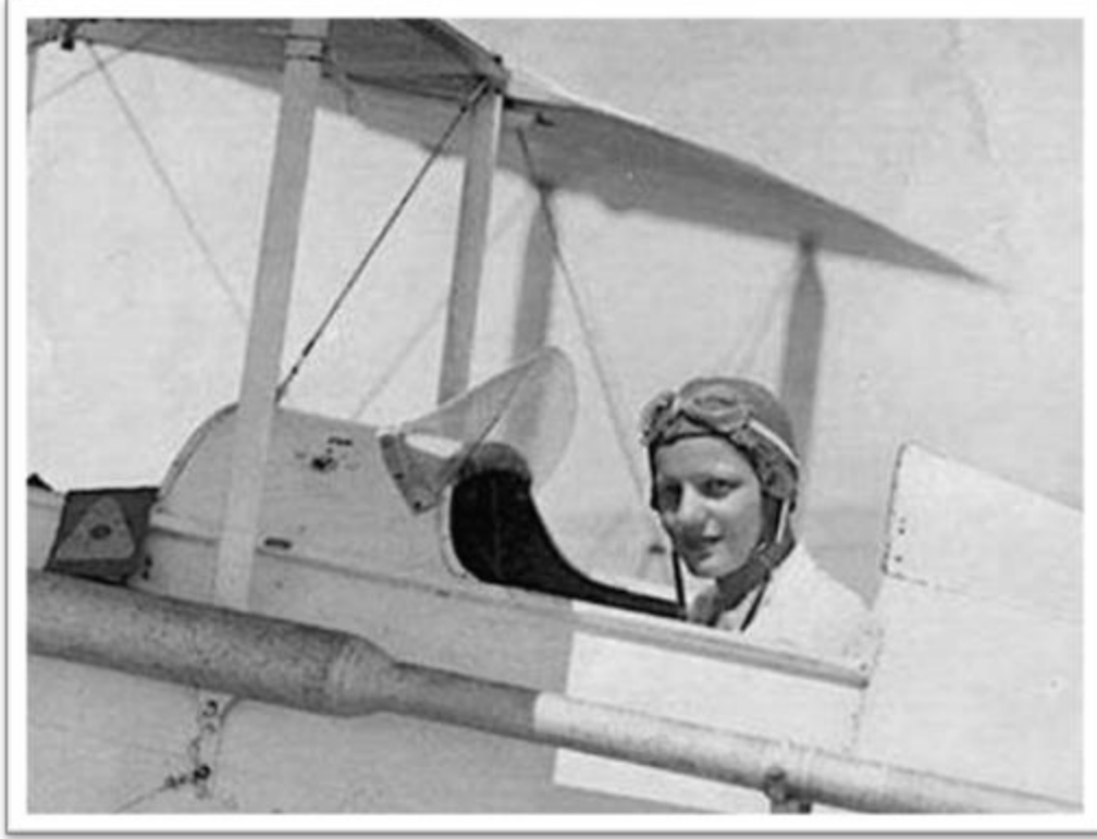
لطفية النادي – Lotfia El Nadi (1907 – 2002)

In 1933, at the age of 26, El Nadi became the first Egyptian woman to earn a pilot's license. She was among the youngest around the world to achieve their dream of flying.