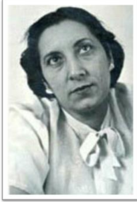
نظيرة نيقولا – Nazira Nicola (1902- 1990)

The most celebrated chef in Egypt and the Arab world, and author of the first cooking book and encyclopedia in Arabic. In 1929, she received her degree in culinary arts and needle work from the University of Gloucester in England. She taught home economics classes at "Saneya Girls School" in Egypt. From teaching and writing books "Abla Nazeera" started a radio show. Her recipes were also published in the weekly women's magazine, Eve.