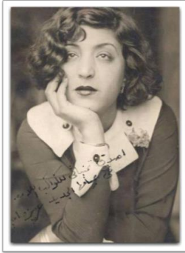
عزيزة أمير – Aziza Amir (1901-1952)

The first female movie director, Amir was widely regarded among the pioneers who established the Egyptian movie industry. In 1927 she acted, directed and edited the movie "Leila" at the age of 26. She produced, acted, directed and wrote many movies that later became landmarks in the Egyptian movie history.