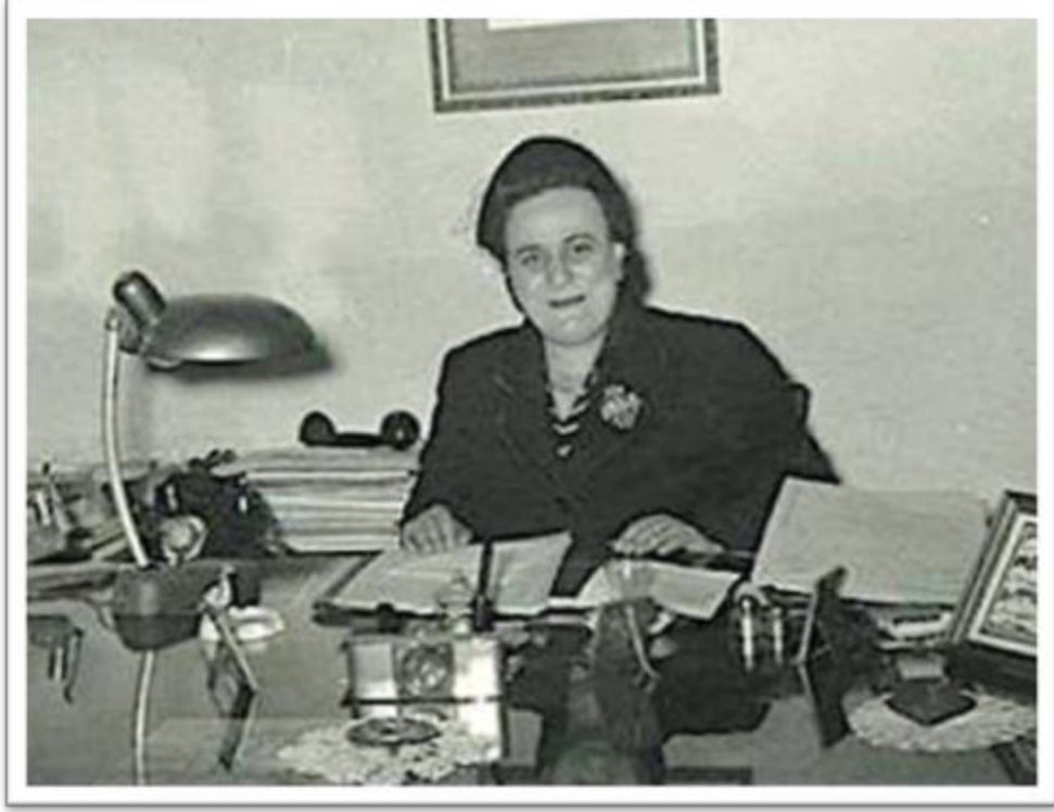
مفيدة عبد الرحمن – Mofida Abdel Rahman (1914 – 2002)

In 1939, Abdel Rahman graduated from law school to become Egypt's and the Arab world's first female lawyer. She opened her law firm and practiced law over a span of six decades, and was the first female lawyer to appear in front of a military tribunal.