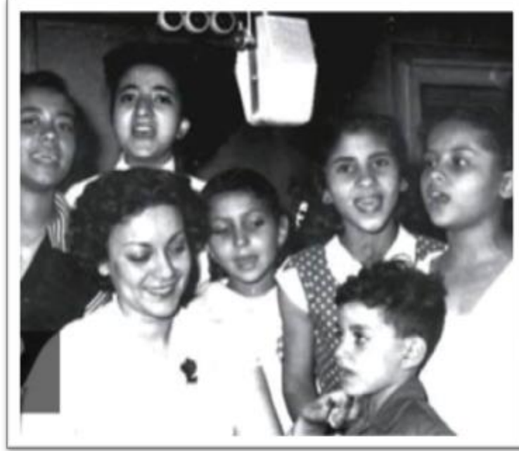
فضيلة توفيق – Fadila Tawfik (1929 -)

Fadila Tawfik a.k.a Abla Fadila presented the most famous children's radio program "A Song and A Story". She graduated from the faculty of law and joined the Egyptian Radio in 1953, where she became a news presenter. In 1959, she hosted the children's program and it became her long-life career.