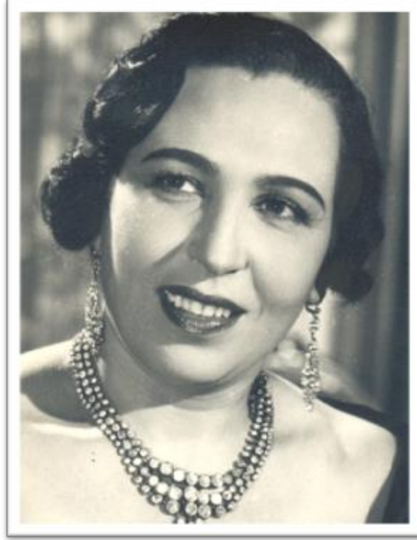
أمينة رزق – Amina Rizk (1910-2003)

At the age of 14, Amina Rizk won a supporting role in a stage production of 'Rasputin' produced by Ramses Theatrical Troupe. Her outstanding performance made her a valued member of the company, acting in approximately 500 plays until the company's dissolution in 1944. In 1928, Rizk embarked on a movie career that spanned eight decades. In 1991, Rizk became the first female artist to be appointed to the Shura Council, the lower legislative body of the Egyptian government.