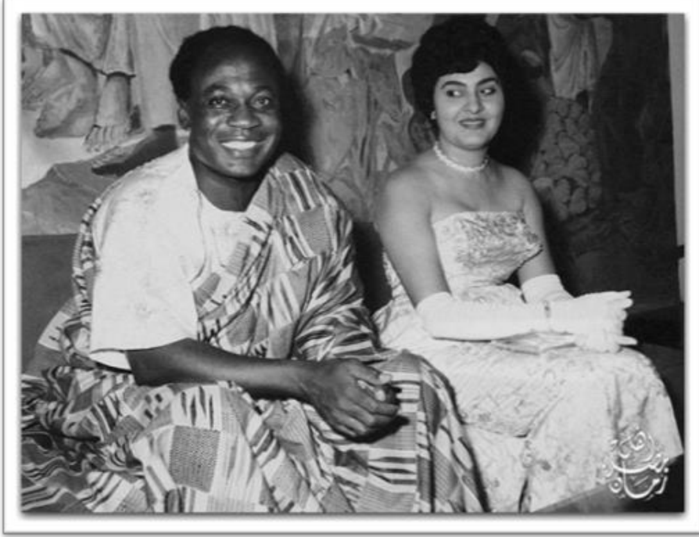
فتحية نكروما - Fathia Nkrumah (1932 – 2007)

The First Lady of the newly independent Ghana. Fathia, wife of Kwame Nkrumah, its' first president, was born Fathia Rizk in Cairo. The couple got married in Ghana on New Year's Eve, 1957–1958. Nkrumah was a young wife and mother of three young children when her husband was overthrown in Ghana's military coup d'état in 1966. She moved back to Cairo, with her children while her husband went into exile.