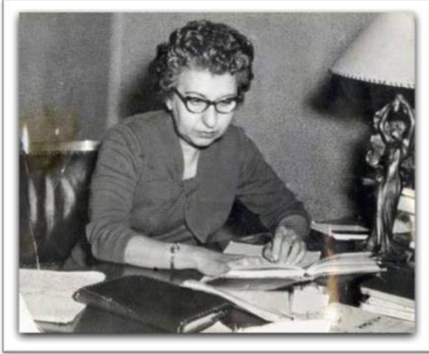
سَهِير القلماوي – Sahir El Qalamawy (1911- 1997)

A celebrated writer, politician and feminist activist in 1929 El Qalamawy was the only woman studying literature at the University of King Fouad. In 1956, she became the first Egyptian woman to earn a PhD in Arabic literature, and the first woman hired as a lecturer by the university. She was also the first female to chair the department of Arabic literature at Cairo University.