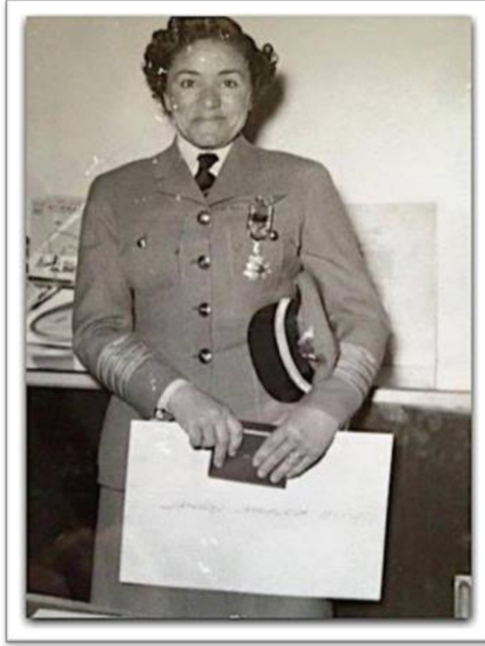
عزيزة محرم – Aziza Moharam (1919 – 1997)

Captain Moharam studied aviation in 1935 and became a flying instructor. After 22,000 hours of flying, she was qualified to become the first Egyptian female chief flying instructor. In 1967, she became the first female managing director of a civil aviation institute in the world.