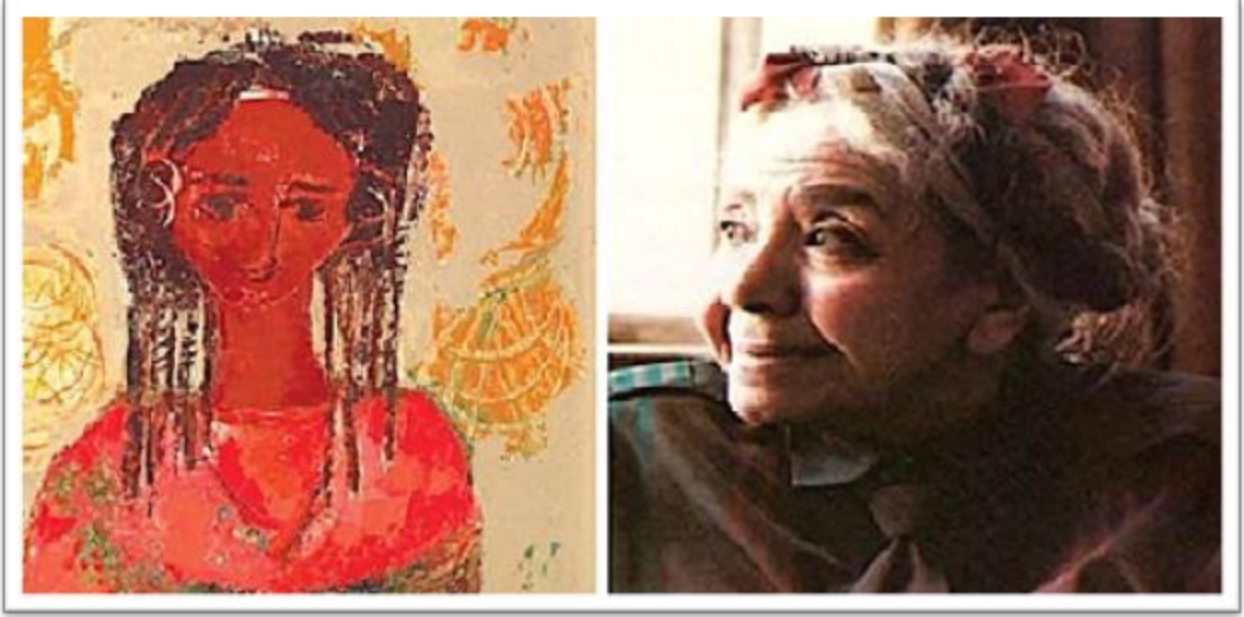
تحية حليم – Tahia Halim (1919 – 2003)

Tahia Halim is one of the pioneer artists of Modern Expressive Movement. She studied at Cairo's Academy of Fine Arts and joined the Académie Julian in Paris between 1949 and 1951. She had developed a personal style in art which came to be known as folkloric impressionism. In 1958, she became the first female to win the Guggenheim prize, and the Guggenheim Museum in New York later purchased Halim's painting 'Hanan' ('Tenderness').