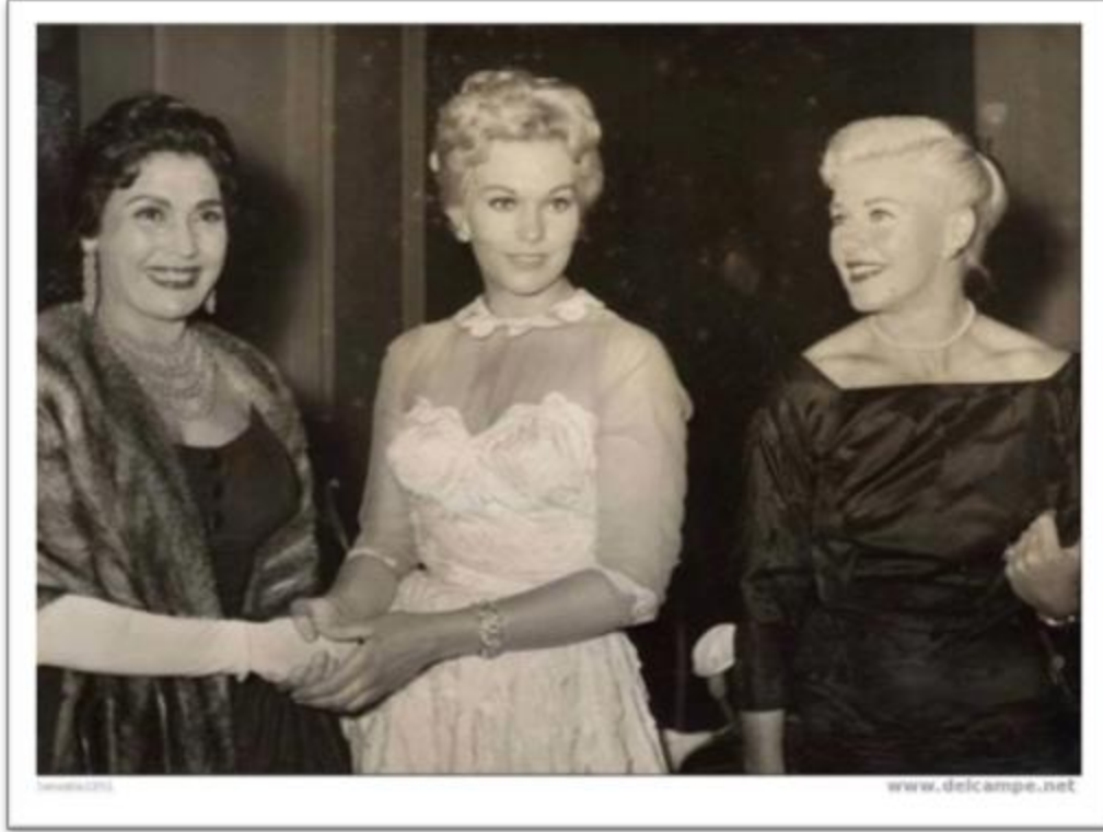
تحية كاريوكا – Taheya Carioca – (1915-1999)

Actress and belly dancer Taheya Carioca was described by Edward Said, professor of literature at Columbia University, as “not only a belly dancer, but an artist who played a role in shaping Egypt’s modern culture.” In 1956, Taheya Carioca’s movie Shabab Imraat (Youth of a Woman) was screened at the Cannes Film Festival. Taheya is seen in the photo with actresses Kim Novak with Susan Hayward at the festival.