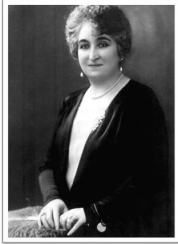
صفية زغول – Safia Zaghoul (1876–1946)

Zaghoul was an Egyptian renowned political activist and among the early members of the Wafd Party. After the exile of her husband, Saad Zaghoul in 1919, she became a central figure of the party, and her home a meeting point for the party members. She became known as Umm al-Misriyyin (The Mother of the Egyptians) and her home in Cairo was called as "Bayt al-Umma" (the House of the Nation).