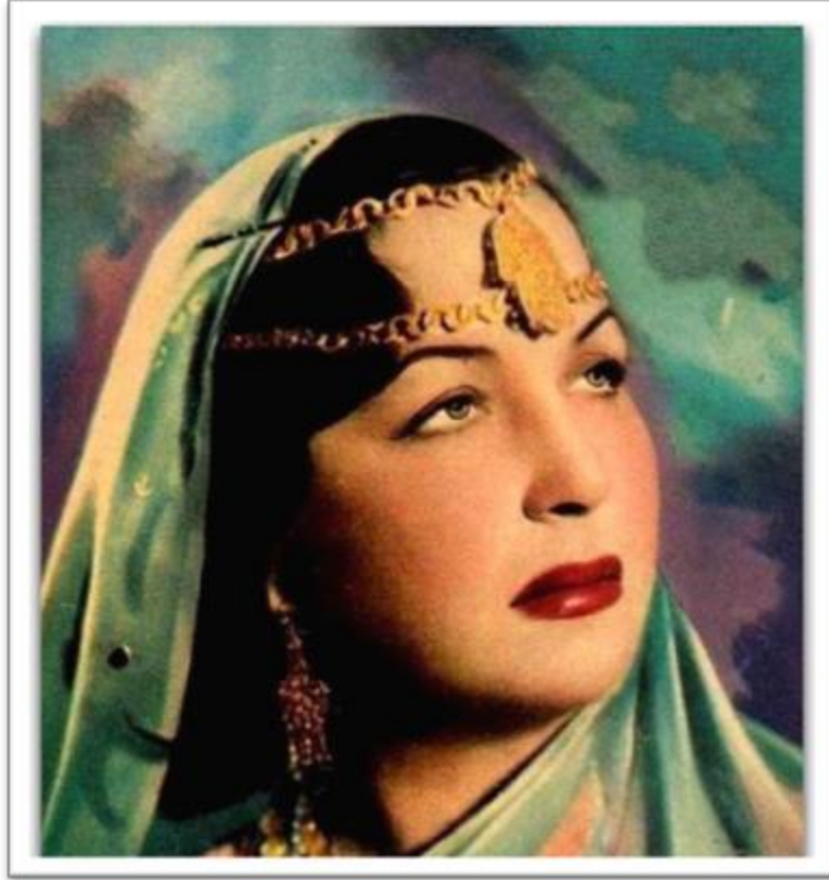
Fatma Roushdy - فاطمة رشدي (1908 – 1996)

An iconic figure in Egyptian theater and film in the 1920s and 1930s, Roushdy became known as “Sarah Bernhardt of the East.” She co-founded a movie production company and became famous in cinema for her leading role in the 1939 film Determination .