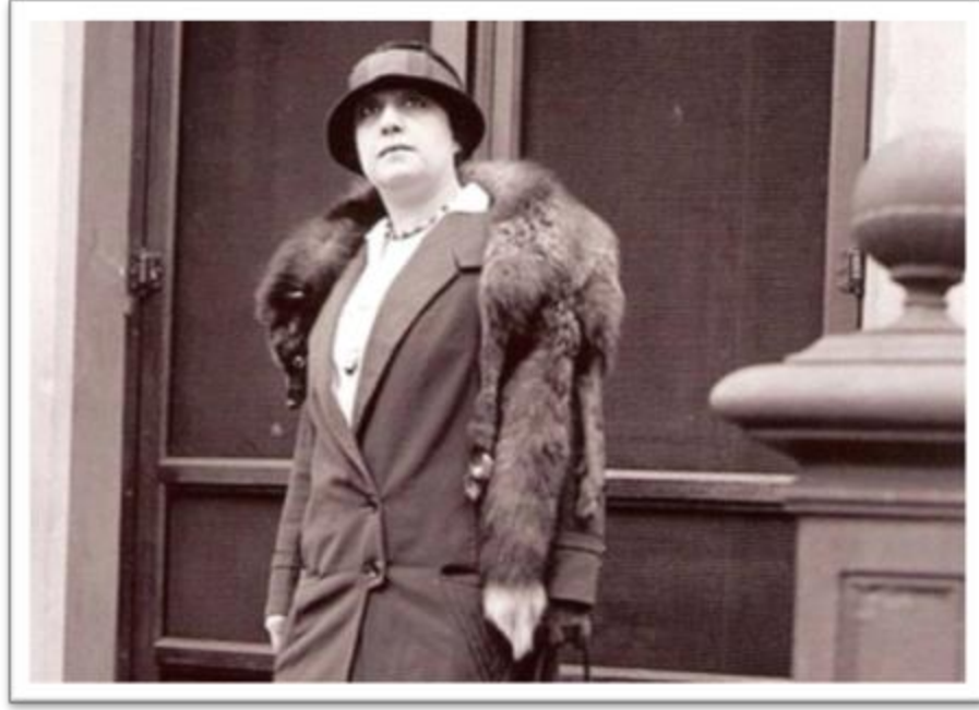
أمينة السعيد - Amina El Said (1914-1995)

A pioneer of women journalism and a women rights activist, Amina El Said was former secretary of the journalist's syndicate and former secretary general of the Pan-Arab League Women's Union. She joined the youth wing of the Egyptian Feminist Union at the age of 14. She was among the first three women to attend King Fouad University in 1931 and earned a degree in English literature in 1935. She became chief editor of the women's magazine Hawaa (Eve) in 1954 and chief editor of Al Musawar magazine in 1973.