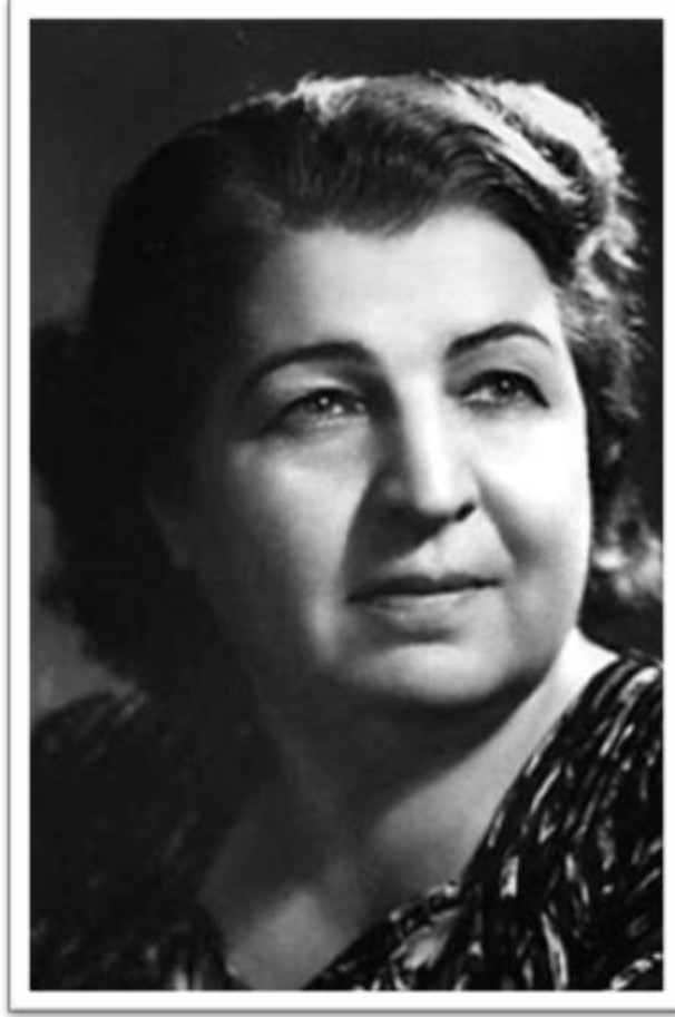
روز اليوسف – Rose El Youssef (1898-1958)

One of the renowned stars of Egyptian theatre at the turn of the century; Rose El Youssef published a weekly magazine in 1925, which initially started as an art magazine. The publication soon launched into politics and social criticism. Rose Al-Youssef magazine remains one of the most popular and widely circulated weeklies.