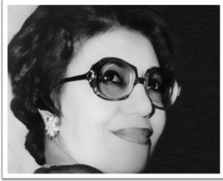
صفية المهندس - Safia Al Mohandes (1922-2007)

Al Mohandes worked for the Egyptian radio in 1947 and was the first female voice to be heard by Egyptians on the radio. She presented the famous program Rabat el-Boyout (Housewives) and in 1965, she became the director of women's programs in the Egyptian radio. She became the president and chair of the Egyptian Radio Broadcasting Corporation in 1975, the first woman to hold this position.