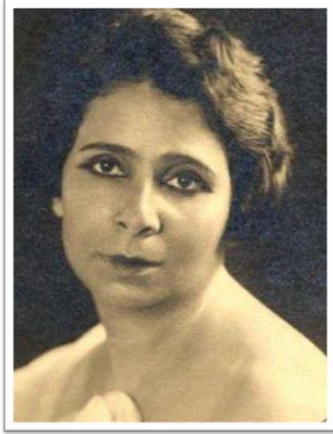
دولت أبيض – Dawlat Abiad (1894 –1978 )

Dawlat Abyad was a pioneer theatrical actress. In 1917, at the age of twenty-three, she played the role of Queen Jocasta in Oedipus Fell . In the cinema, she played a part in Zeinab , the first Egyptian silence movie produced in 1930.