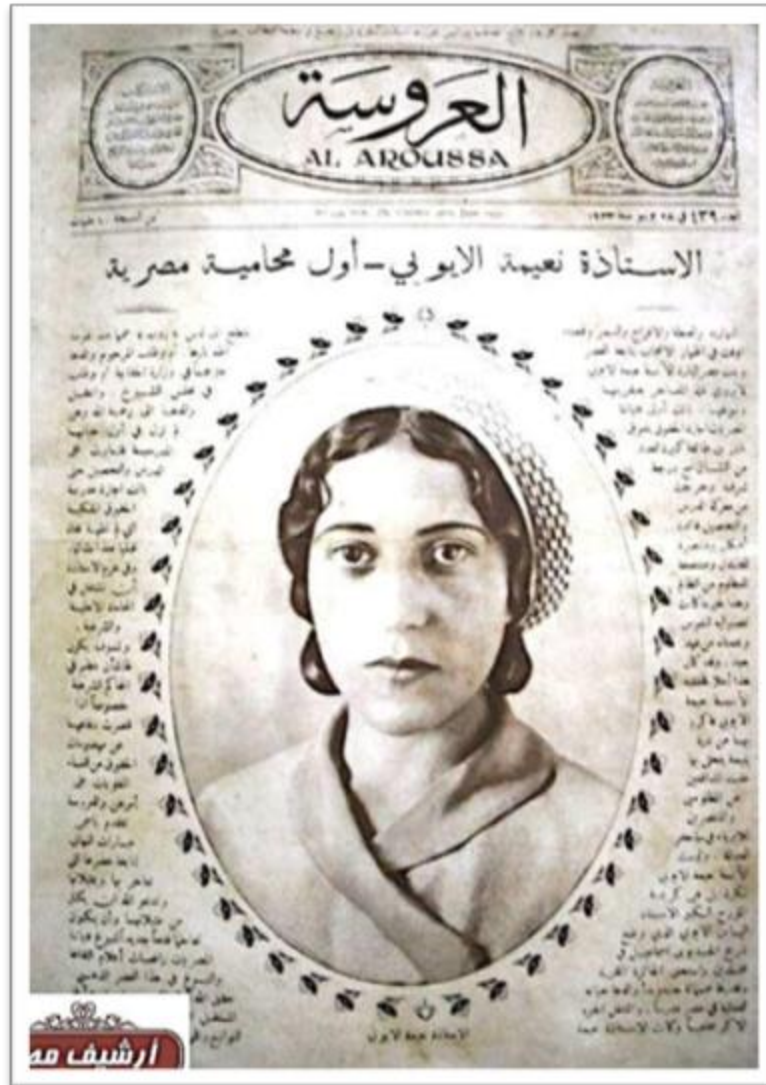
Naima el-Ayoubi, first female lawyer in Egypt on the cover of "Al Aroussa" Magazine in 1933.

الاستاذة نعيمة الأيوبي اول محامية مصرية على غلاف مجلة العروسة عام ١٩٣٣.