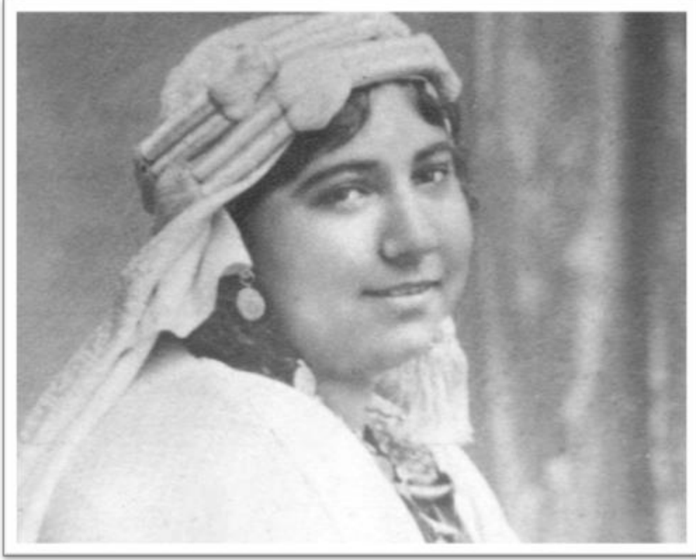
ملك حفني ناصف - Malak Hefni Nasif (1886 – 1918)

Malak Hefny Nassef, a.k.a Bahethat Al Badey (Desert Researcher) was a writer, an advocate for social reform and a pioneer suffragist in the early 20th century. She was the first Egyptian woman to publicly call for the liberation of women. At the Nationalist Congress in 1911, she issued the first set of feminist demands, which included women's right to education and work.