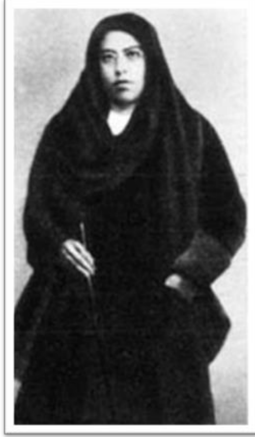
نبوية موسى – Nabaweya Moussa (1886 – 1951)

A pioneer in women's education in Egypt, Nabaweya Moussa was the first female student to get a high school diploma in 1907, and the only Egyptian girl to have this degree for the following 21 years. Women's education was her main cause and she fought for it for nearly forty years (1904-1946). She was the first headmistress of a girl's school.