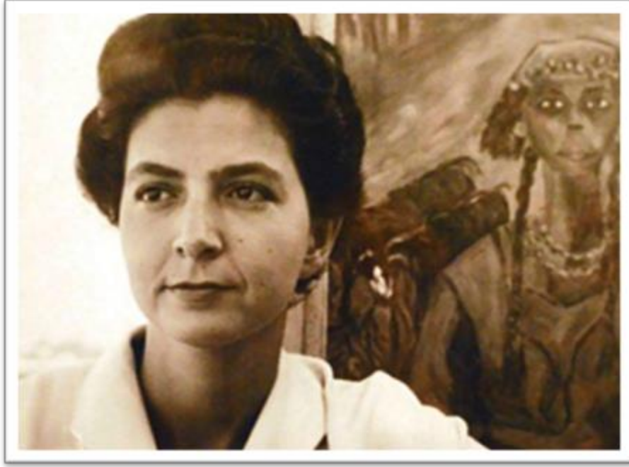
انجي أفلاطون – Inji Aflaton (1924 – 1989)

Efflatoun was a feminist and political activist as well as an artist. At the beginning of the 1940's, she was one of the first women to attend the Faculty of Arts at Cairo University. In 1950, Efflatoun joined the Youth Committee of the Egyptian Feminist Union. In 1951, and together with other female activists in the organization they organized the Women's Committee for Popular Resistance, to coordinate women's efforts in the resistance movement against the British