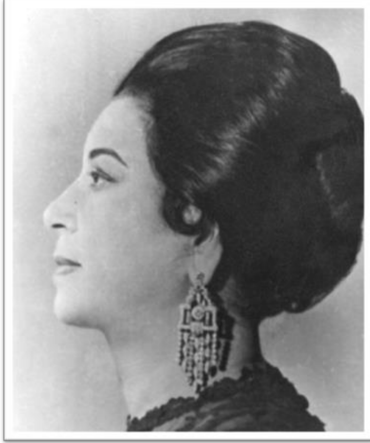
أم كلثوم – Om Kolthom (1975 – ??)

The Egyptian Diva was not only the first woman to become the president of the musicians' syndicate, but it was also her idea. In 1942, after winning the election against musician and singer Mohamed Abdel Wahab, she headed the syndicate of musicians for 7 years.