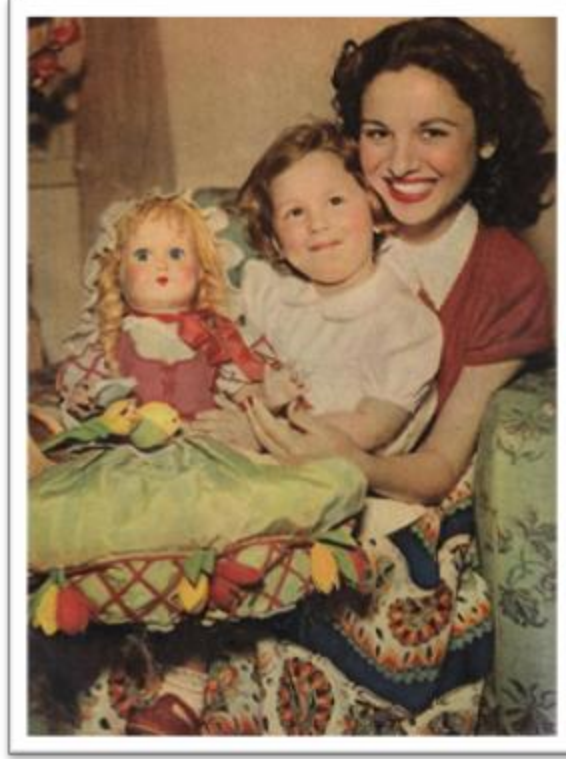
Faten Hamama – فاتن حمامة (1931- 2015)

The “Dame of the Arabic Cinema,” was Faten Hamama’s unofficial title that accompanied her throughout her life. Her movies shed the light on women issues and shaped the lives of women in Egypt and the Arab world for generations. All her movies in the last twenty years of her wife were dedicated to women’s issues. She played leading roles in more than one hundred movies. Seven of her movies were included in the top best one-hundred films in the history of Egyptian cinema.