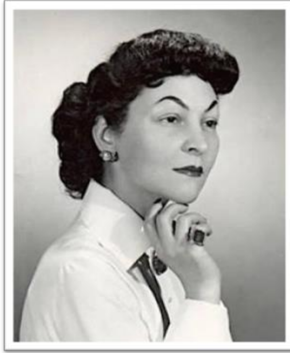
درية شفيق - Doria Shafik (1908 – 1975)

A feminist, writer, editor, and a leader of the Egyptian suffragette movement in the 1940s. In 1951, she led a women's march to the Parliament and a three-hour sit-in. In 1954, Shafik undertook an eight-day hunger strike, in protest over the no representation of women in the constitutional committee and to demand the right for women to vote. As a result of Shafik's efforts women were granted the right to vote under the constitution of 1956.