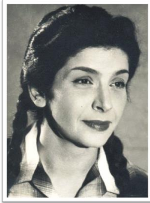
سناء جميل - Sanaa Gamil (1930 – 2002)

One of the best Egyptian theater actresses, Sanaa Gamil played a number of roles on the French Stage for La Comedie Francaise. In 1961, she won best supporting actress award at the Moscow Film Festival for her role in the movie Bidaya wa Nihaya (A Beginning and an End) based on a novel by Nobel Prize winner Naguib Mahfouz. Omar Sharif played the leading role.