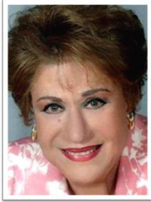
سميحة أيوب – Samiha Ayoub (- 1932)

The Queen of Arab Theater, Samiha Ayoub graduated from the Theater Institute in 1953 and joined Al-Qawmmy Theater (The National Theater). Samiha was the director of the Modern Theater (1972-1975) and became the director of the National Theater in (1975-1985). For her outstanding career, they named the big hall in the National Theater after her, in a celebration that took place in 2015.