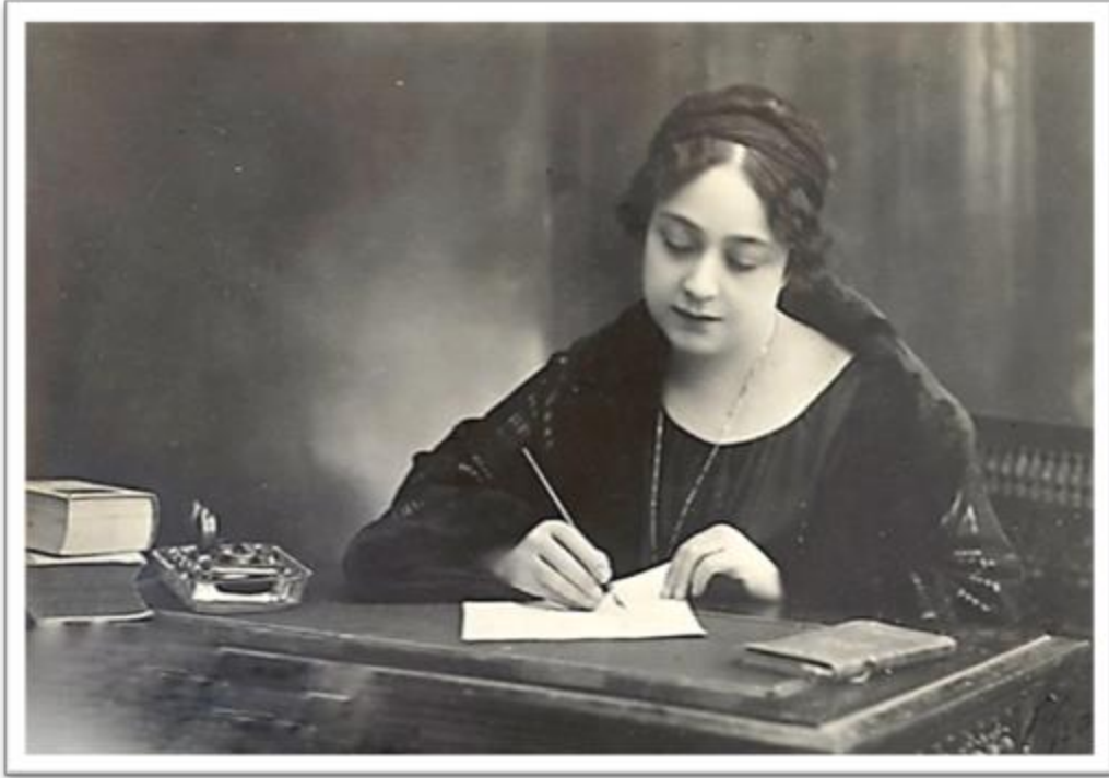
هدى شعراوي – Huda Shaarawi (1879-1947)

Leader of the Egyptian suffragette movement, Sharawy not only influenced women in Egypt but throughout the Arab world. In 1910, she opened a school for girls. In 1919, she helped organize the largest women's anti-British demonstration. In 1923, she founded the Egyptian Feminist Union, which she led until her death. In the same year and upon her return from a women's conference in Rome, she removed her veil in public for the first time, in front of a big crowd.