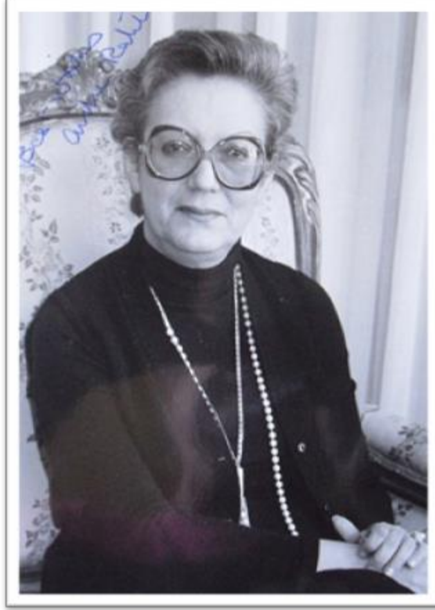
عائشة راتب – Aisha Rateb (1928 – 2013)

A lawyer, politician, human rights and women's activist, Aisha Rateb served as Minister of Social Affairs from 1974 to 1977. She was also appointed as Egypt's first female ambassador where she led the diplomatic mission in Denmark and West Germany. Rateb received her PhD in international law in 1955, and became the head of International Law Department at Cairo University.