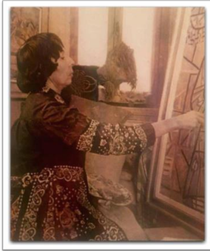
عفت ناجي – Effat Nagi (1905-1994)

A distinguished artist whose art is sold in galleries and auctions worldwide. She studied fresco and mural paintings in Rome, Italy, from 1947 to 1950. Nagi was the first artist whose works were housed in the Museum of Modern Art in Cairo in 1928. After her death, her house in Cairo was transformed into one of the most important art museums of Cairo.